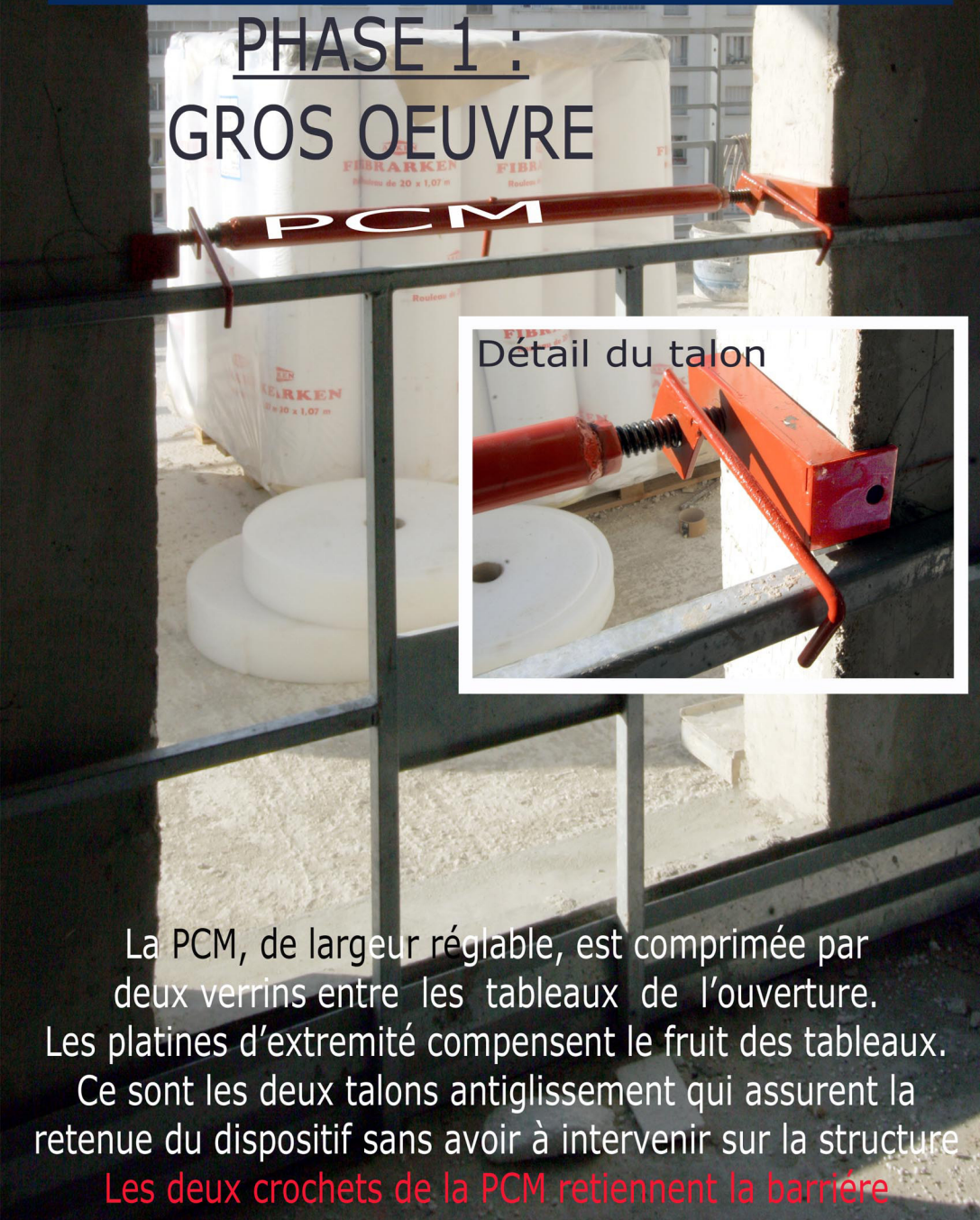
Détail du talon