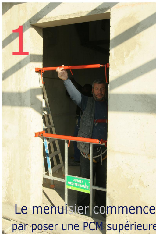
Le menuisier commence par poser une PCM supérieure