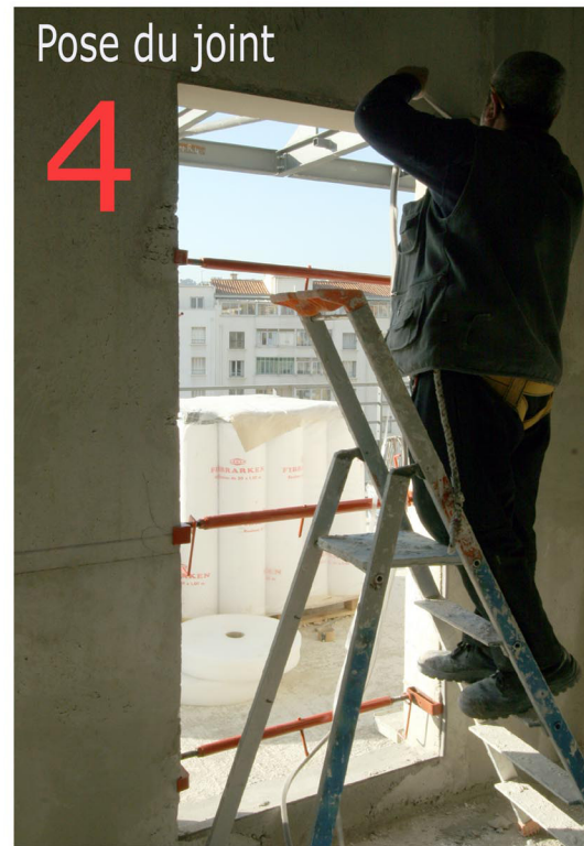
Le talon de la PCM est intercalé entre la maçonnerie et la menuiserie ( jeux de pose de la menuiserie : 5mm )