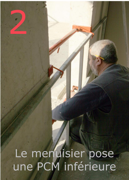
Le menuisier pose une PCM inférieure